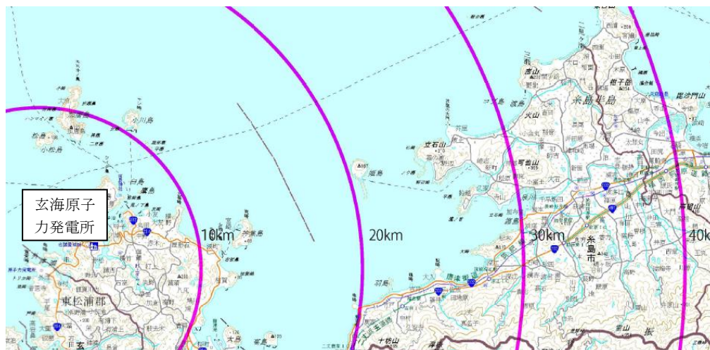
【 第1図 個別計画を事前に策定すべき地域の範囲 】

※ 本図は、国土地理院九州地方測量部から防災用として提供を受けた基盤地図を使用して作成されています。本図は、防災目的に限り利用できます。