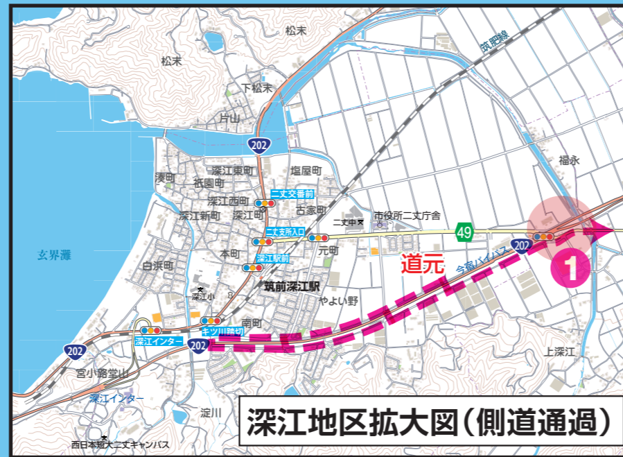
深江地区拡大図(側道通過)